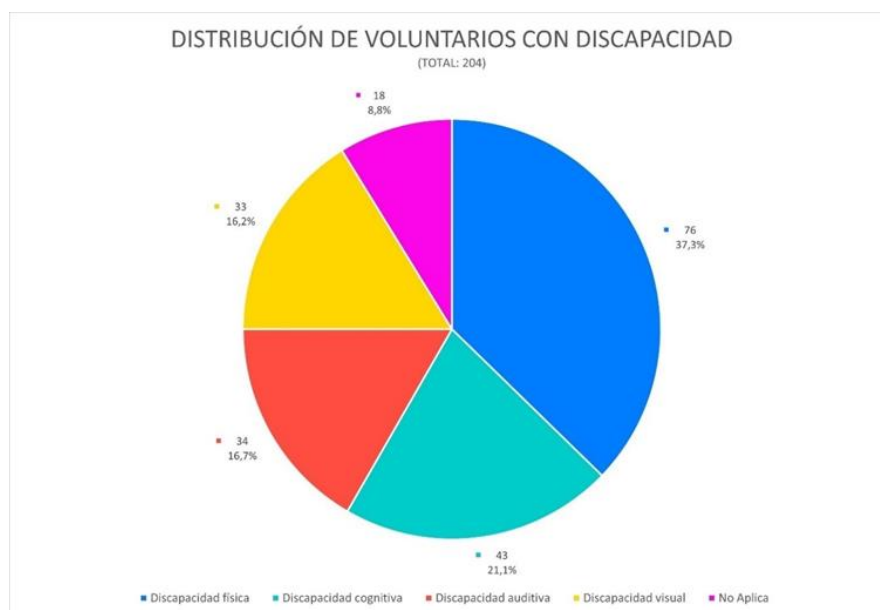
Imagen 6.- Distribución Voluntarios con Discapacidad – JPA

Finalmente, 204 voluntarios declararon ser personas con alguna discapacidad (entre auditiva, cognitiva, física y visual). A continuación, en el Gráfico 3, se muestra la distribución de personas según su discapacidad: