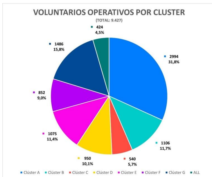
Imagen 4.- Voluntarios Operativos por Clúster – JPA

Las tres sedes con mayor afluencia de voluntarios fueron la Villa Panamericana y Parapanamericana (clúster G) con 1.184 participantes, le siguen el Coliseo del Estadio Nacional Julio Martínez (clúster A) con 637 participantes y el Centro de Entrenamiento Olímpico (clúster B) con 508 participantes.