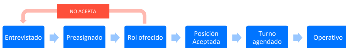
Imagen 3.- Carrera del Voluntariado.

Para la preasignación de roles, era requisito fundamental que el postulante a voluntario estuviese en estado de entrevistado, y además contara con el chequeo de antecedentes aprobado. La carrera del voluntario dentro del sistema WMS correspondía según lo mostrado en la Imagen 3.- Carrera del Voluntariado .