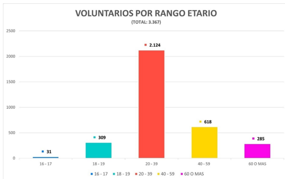
Imagen 8.- Distribución Voluntarios por Rango Etario – JPP

Adicionalmente, el 83,96% de los voluntarios operativos son de nacionalidad chilena; seguidos por Venezuela con un total de 206 voluntarios (equivalentes al 6,12%), y Perú junto a Brasil con un total de 78 voluntarios cada uno (equivalentes al 2,32%). Respecto de los países de residencia de los voluntarios extranjeros, provenían de 28 nacionalidades distintas.