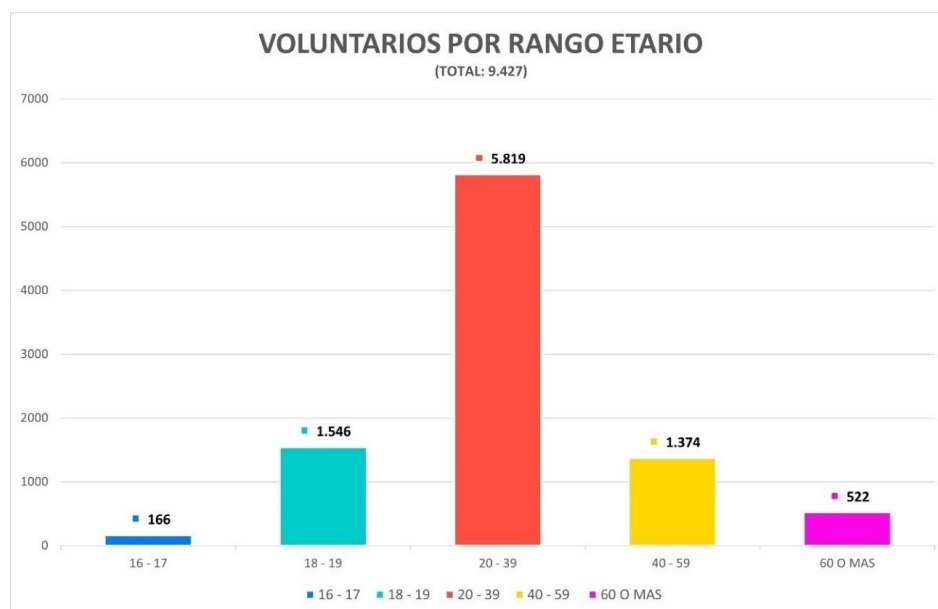
Imagen 5.- Distribución Voluntarios por Rango Etario – JPA

Adicionalmente, el 83,82% de los voluntarios operacionales son de nacionalidad chilena; seguidos por Venezuela con un total de 456 voluntarios (equivalentes al 4,84%), Perú con un total de 298 voluntarios (equivalentes al 3,16%) Y Argentina con un total de 185 voluntarios (equivalentes al 1,96%). Al analizar la participación de personas extranjeras es relevante indicar que asistieron voluntarios de 46 nacionalidades distintas.