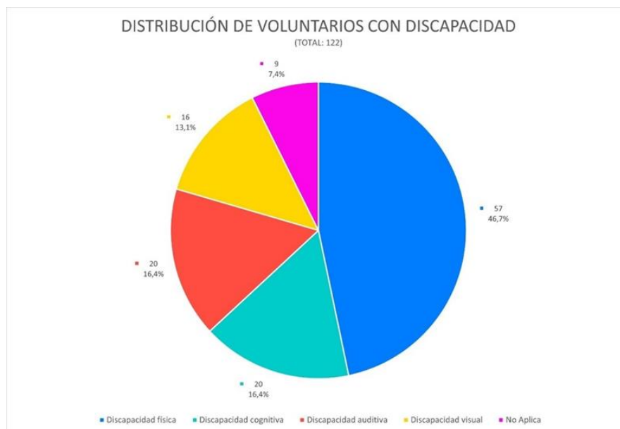
Imagen 9.- Distribución Voluntarios con Discapacidad – JPP