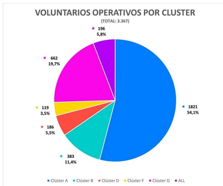
Imagen 7.- Voluntarios Operativos por Clúster – JPP

Las tres sedes con mayor afluencia de voluntarios fueron la Villa Panamericana y Parapanamericana (clúster G) con 494 participantes, le siguen el Centro Atlético Mario Recordón (clúster A) con 328 participantes y el Common Domain (clúster A) con 323 participantes.